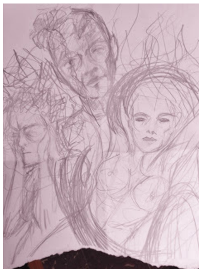
Ilustración de: Luka Adler