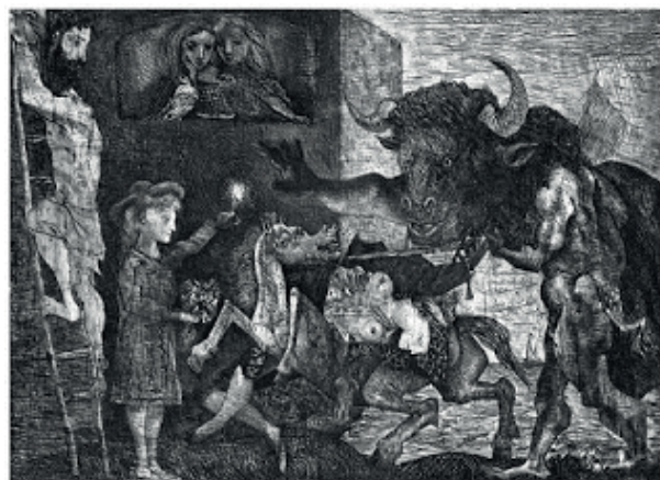
Minotauromaquia, Pablo Picasso (1935)