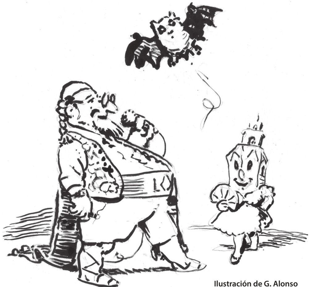
Ilustración de G. Alonso